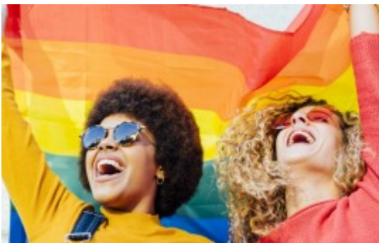
Education & Awareness [2]